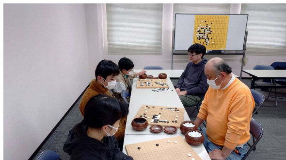
囲碁普及の会 活動状況写真