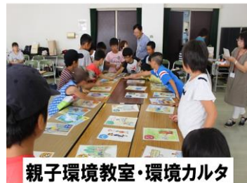
親子環境教室・環境カルタ