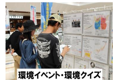
環境イベント・環境クイズ