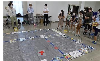
親子環境教室・環境スゴロク