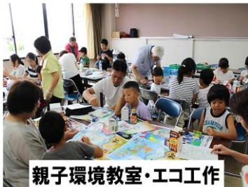
親子環境教室・エコ工作

私たちは生活者の目線で地球温暖化防止啓発活動をしています。地球温暖化に関わる身近な環境問題について親子環境教室や環境イベント(各々年2回)で、牛乳パックによるエコ工作や環境カルタや環境スゴロクを親子で楽しみながら温暖化を防ぎ、自然環境を守っていくことの大切さや、私たちにできる事を共に考え、生活でのヒントにしていただいています。環境に優しい生活スタイルへの行動につながる活動を目指しています。