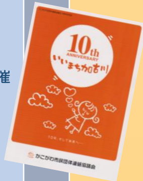
▲10周年記念誌 オレンジはイメージカラー